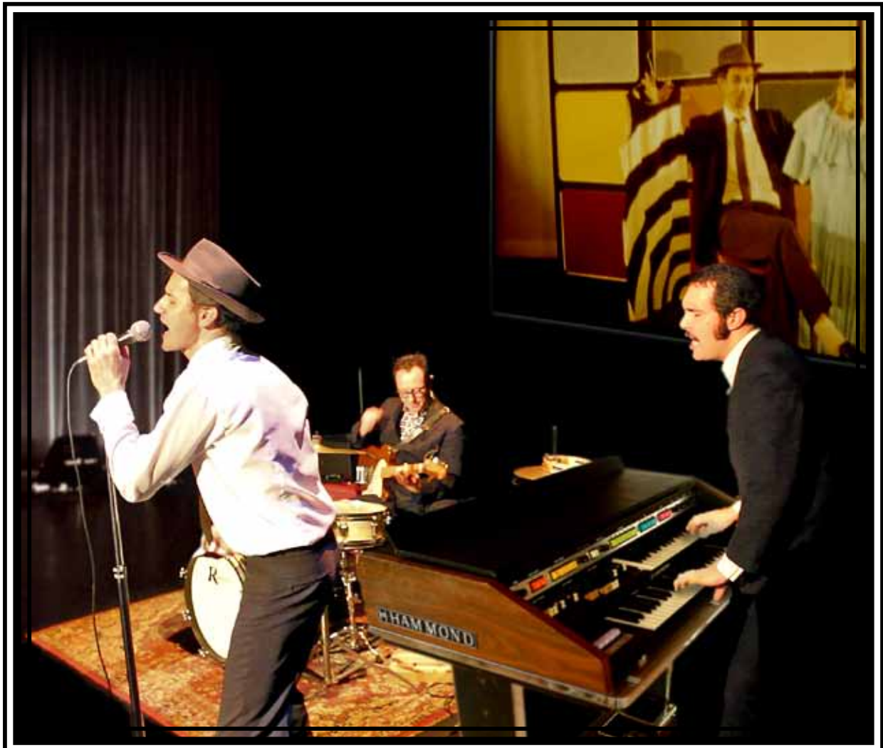
Photo des «White Sockets» en résidence au Théâtre Epidaure de Bouloire

Avec ce nouveau spectacle intitulé « THE WHITE SOCKETS EXPERIENCE PROJECT », il revisite à sa manière un genre cinématographique appelé « SCOPITONE », le «clip» des chanteurs, chanteuses et groupes des années 60-70.